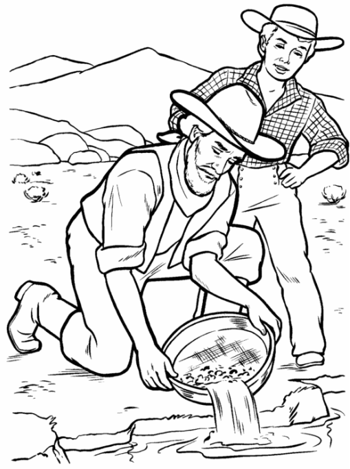
Gold was discovered in California in 1849. People who rushed to California to make their fortunes were called Forty-niners.

Najděte, který symbol chybí v některé ze čtyř komůrek